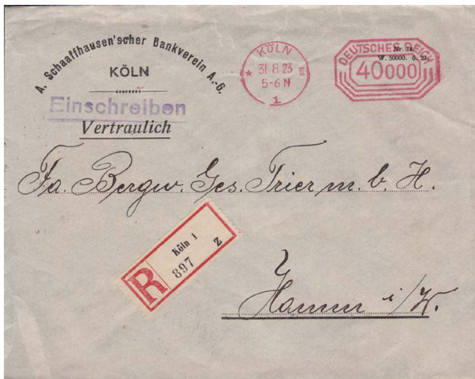
R-Fernbrief von Köln nach Hamm, Porto und Einschreibgebühr jeweils 20.000 Mark. Freigemacht mit Maschinen-Postfreistempel.